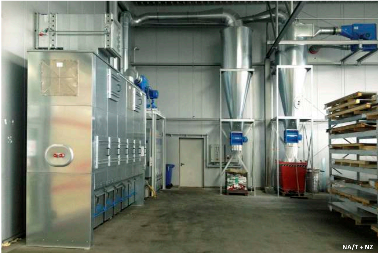
NA/T + NZ

Les filtres à ensachage sont fabriqués pour fonctionner en mode surpression (type Nasf) ou dépression (types NA/T et NUAF/T). Ils sont totalement étanches et conçus sous forme modulaire extensible à volonté. Nos techniciens planifient pour chaque besoin le système adéquat et sélectionnent le meilleur média filtrant.