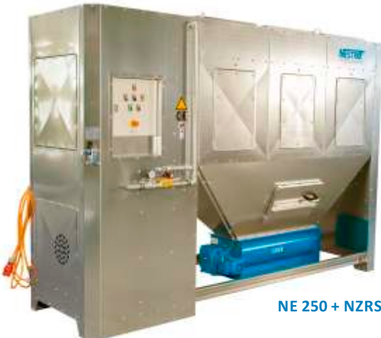
NE 250 + NZRS

Unsere fünf mobilen Entstauber NE für die Innenaufstellung erfüllen alle Normen hinsichtlich Reststaubgehalt, Schallimmission und Absaugleistung. Deren kompakte Bauweise mit der Option Ansaugseite rechts/links bietet Ihnen viele Möglichkeiten einer platzsparenden Aufstellung. Die drei Austragungssysteme Tonnenabsackung, Brikettierpresse und Zellenradschleuse erfüllen jede gewünschte Anforderung an eine perfekte Lösung.