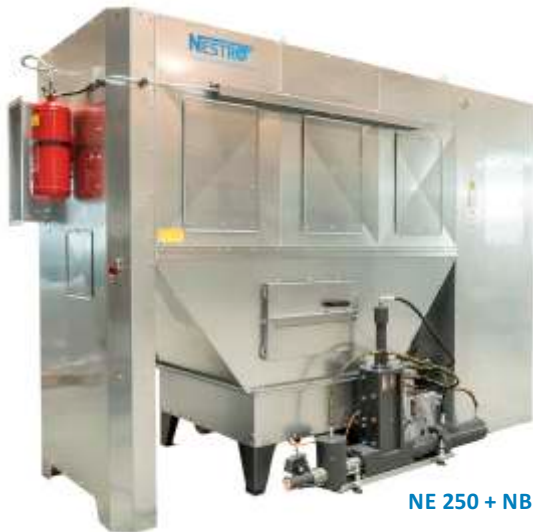
NE 250 + NBP